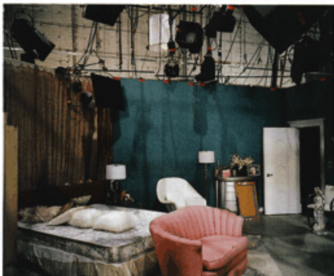
Aux studios Paramount. At Paramount Studios.